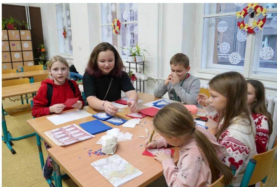
Vánoční dílny pro rodiče a veřejnost – prosinec 2023

Jakub Pletánek - 1.místo na Mistrovství ČR v hokejbalu (kategorie U13)