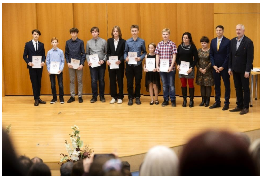
Oceňování nejlepších žáků a studentů za školní rok 2022/2023