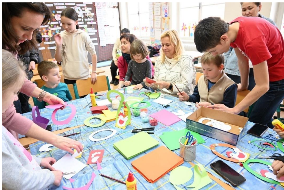
Velikonoční dílny – 25.3.2024