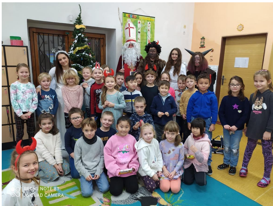
Mikulášská nadílka – prosinec 2023

Školní rok ukončilo celkem 537 žáků, z toho 298 s vyznamenáním. Neprospělo 11 žáků. Podle § 38 se vzdělávalo 12 žáků. Podle § 41 se vzdělává 1 žákyně.