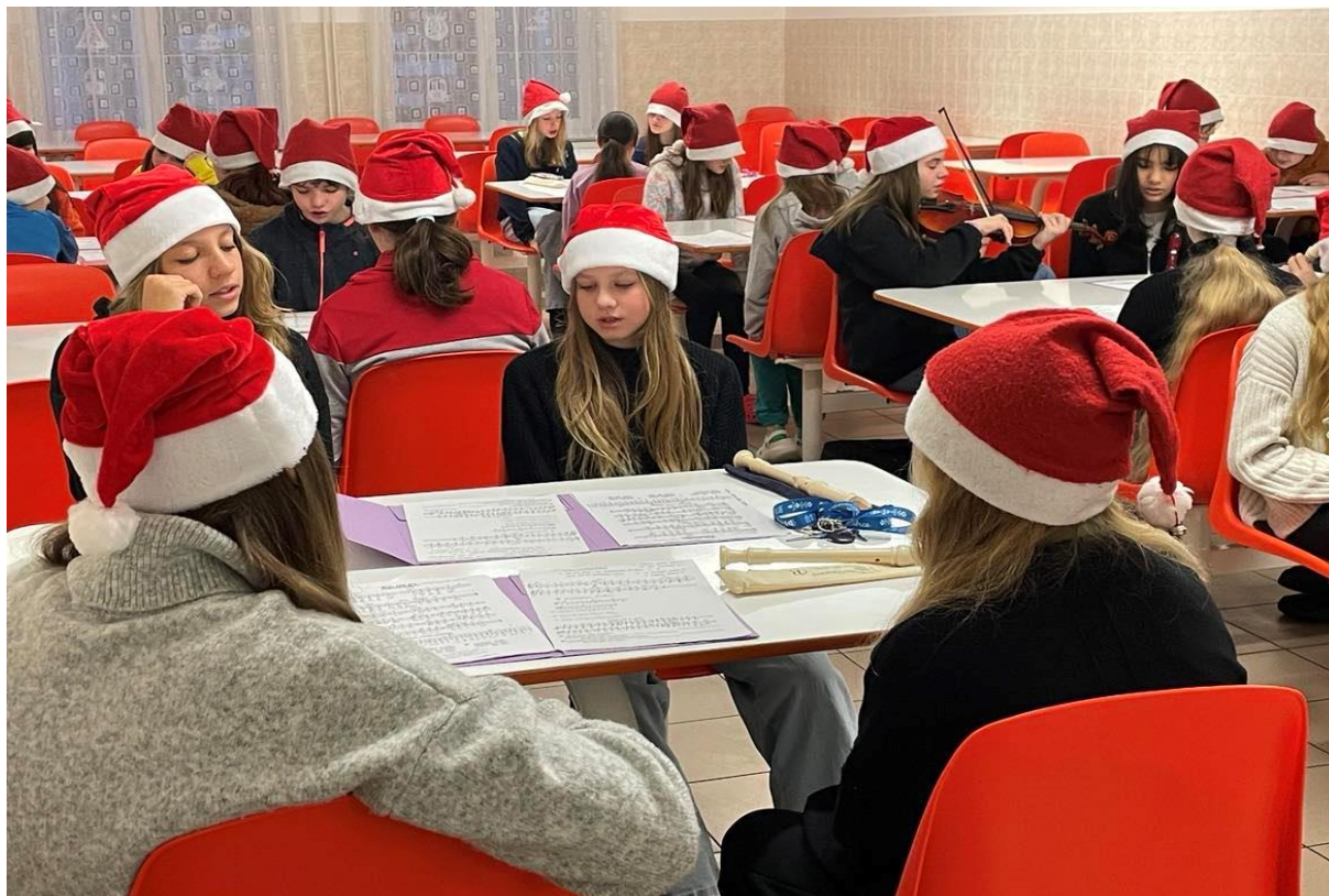
Vánoční koncertování – pro paní kuchařky ve školní jídelně