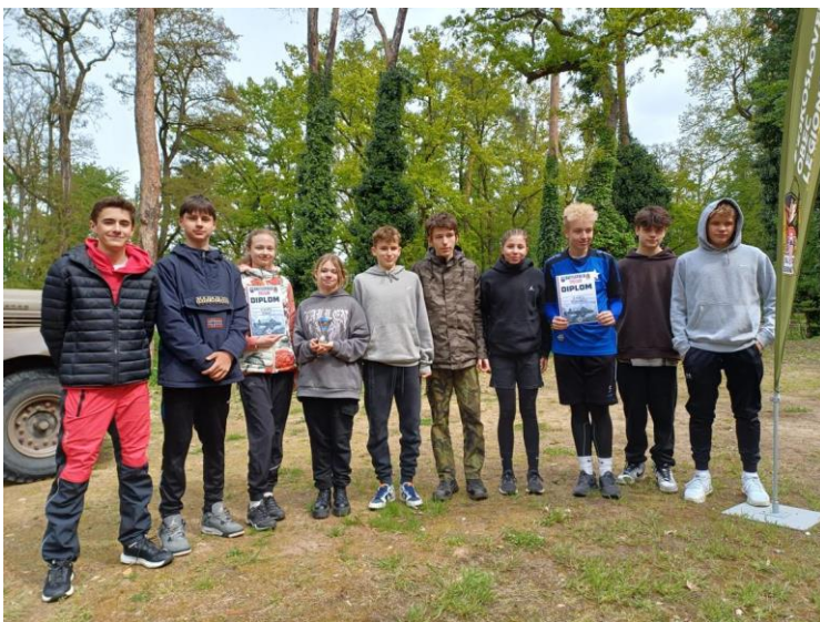
Battlefield – areál Larischovy vily