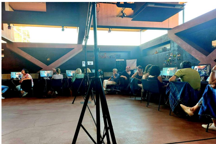
Sféra (v areálu Automatických mlýnů) – školení pedagogického sboru