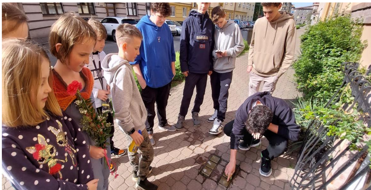
Čištění kamenů zmizelých – Nerudova ulice