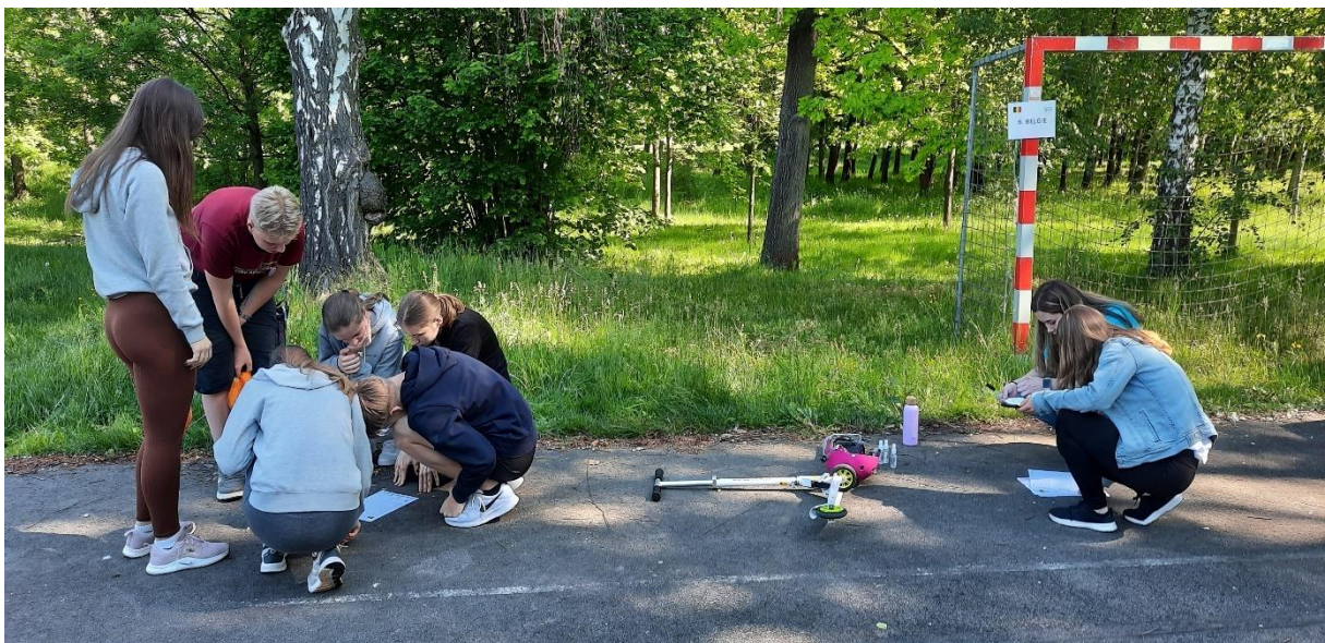
Den Evropy – park Na Špici

Na další vzdělávání pedagogických pracovníků jsme v roce 2023 vynaložili částku ve výši 36 512 Kč. Na školení nepedagogických zaměstnanců částku 11 211 Kč.