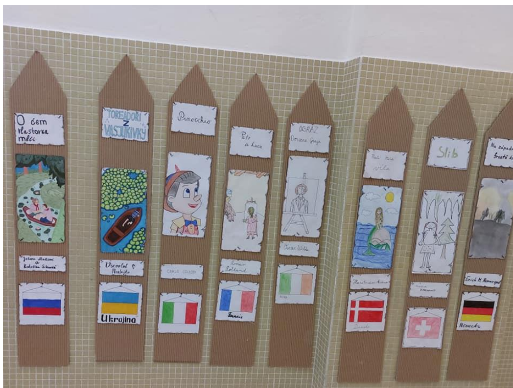
Projekt „Za plotem aneb Co se čte u sousedů“